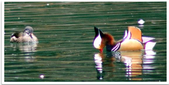
♀に結婚のお願いをする♂のオシドリ

バードウォッチングは、自然の中で野鳥を観察して楽しむことを言いますが、その目的は野鳥を通して自然に親しみ、自然を守ることにあります。日本で一番大きな環境保護団体である日本野鳥の会や日本鳥類保護連盟もほぼ同じような目的で活動しています。当会の名称は、この二つの団体から「野鳥」と「保護」をいただき、宇部野鳥保護の会として1977年に設立されました。 自然を守るためには、①自然に親しむ（関心、気づく）②自然を知る（野生生物の暮らしを知る。知識）③自然を守る（その生物を守る。行動）の三つのステップがあります。まずは観察会で自然に親しみ野鳥を観察してみましょう。新しい発見や気づきがあります。すると、もっと知りたいと思ひ調べたりする事で知識がつかます。対象となる生きものの生息環境がわかると、その環境が危ぶまれる場合には、それを守らなければと思っても、一人の力では難しく、多くはここで立ち止まってしまいましたが、同じ仲間がいる会に所属する事で大きな力になり、守るための行動を起こすことができます。