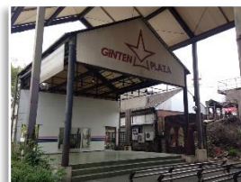
改修を待つ屋根付き広場