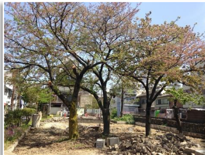
工事が進む中央街区公園の様子