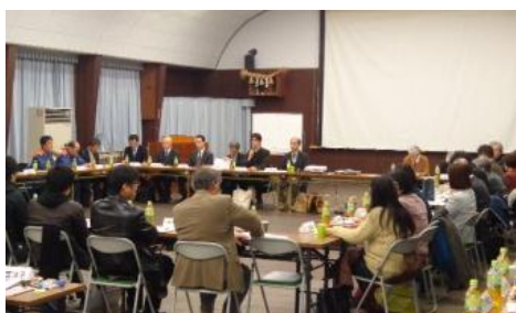
今年のRC宇部地区対話集会の様子 (2013.1.26 セントラル硝子株式会社宇部工場にて)