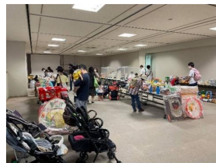
写真 回収ボックスのゴミと、子育てグッズ配布の広場