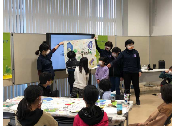
こどもワークショップ

しながら、人・情報・技術を効果的に共有させ、地域の課題解決や新ビジネスの創出などに取り組んでいます。