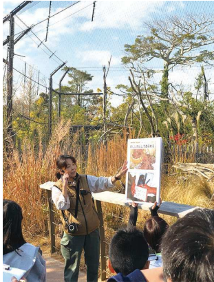
ときわ動物園でのフィールドワーク

そうした中、2019年4月に、起業・創業の拠点である「うべ産業共創イノベーションセンター志」内に、SDGs推進拠点として「宇部SDGs推進センター」を設け、市民・企業・大学など多様な主体が連携